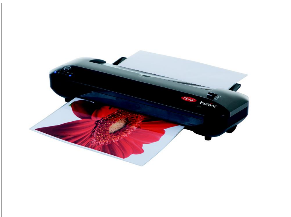
Laminátor PEAK PI 320