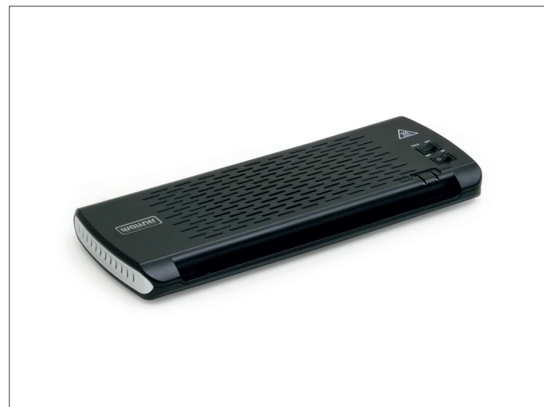
Laminátor Wallner OL 290